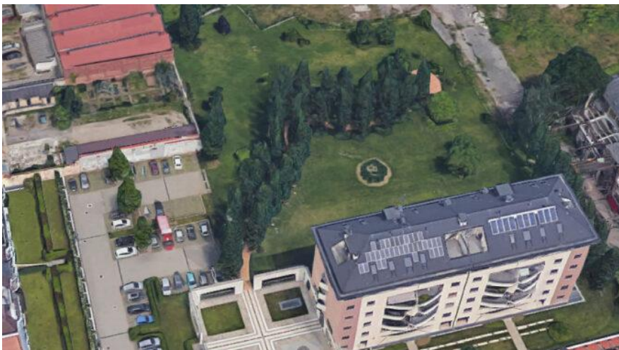
Il parco di via Carlo Maria Piazza e, in basso, il condominio

🕒 11/03/2023 👤 Andrea Aliverti 📍 BUSTO ARSIZIO | VALLE OLONA